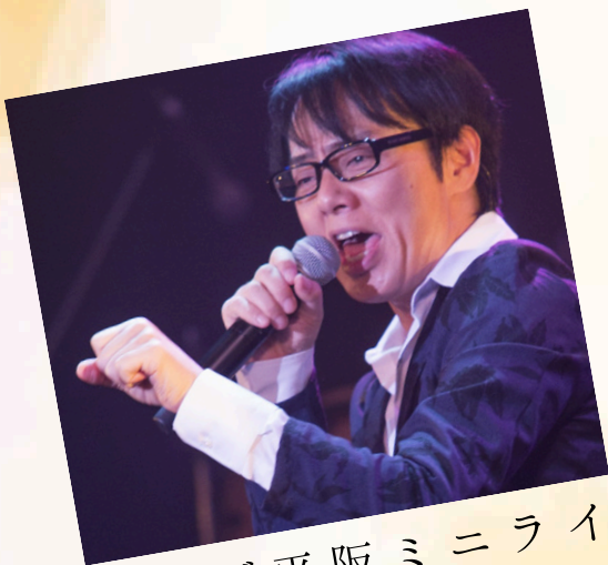
ウインズ平阪ミニライブ