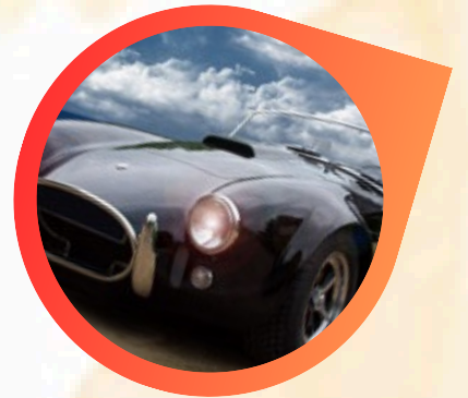
クラシックカー展示