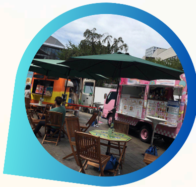
キッチンカーと地域特産物販売